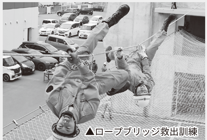
▲ロープブリッジ救出訓練