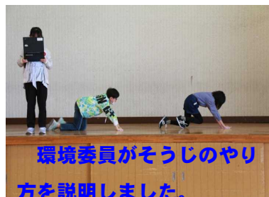
環境委員がそうじのやり方を説明しました。

高学年になると、各委員会やクラブ活動、縦割り班活動などで、先に立って活躍する場面が増えます。このような活動を通して、高学年としての自覚や自信をもって活動できるようになり、また、他の学年の子どもたちも自分の役割をもち、進んで活動に参加することができます。今年度も縦割り班活動(清掃活動、運動会、花植え、集会活動など)によって人間関係を広めたり深めたりする中で、どの子もよさを生かし自己有用感を高めていけるよう、子ども主体の活動を実践していきます。