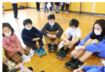
←縦割り班の友だちと顔合わせ会をしました。