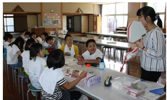
5月25日 3年歯みがき指導