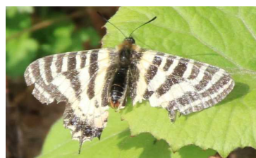
カタクリの群生とヒメギフチョウ