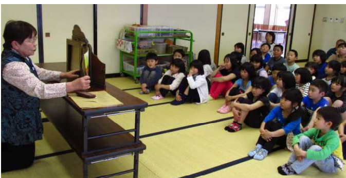
5月15日 読み聞かせ1回目