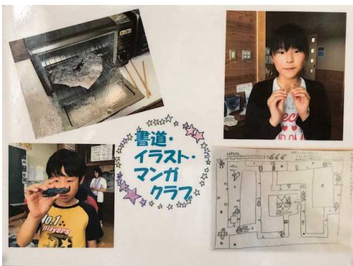
書道まんがクラブ