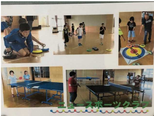
ニュースポーツクラブ