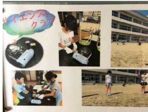
サイエンスクラブ