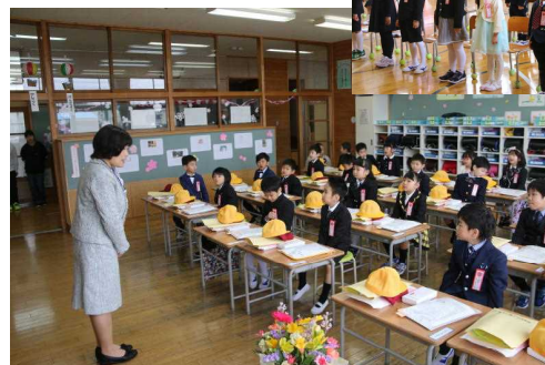
入学式の後、担任の話を聞く新入生