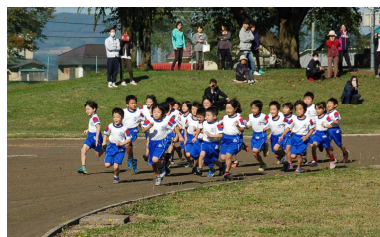
真剣な顔の1年生スタート