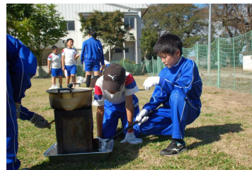
去年はどうやったっけ？