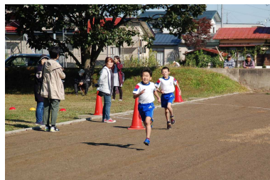
ラストスパート2年生