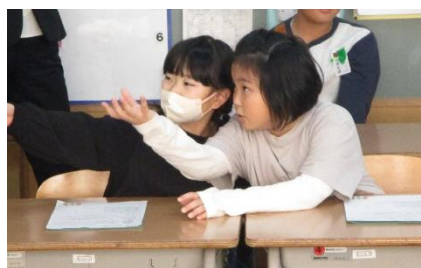
友達と相談しています。

どんなゲームにするか一つには絞り切れませんでしたが、活発に意見を出すところはとても良かったです。