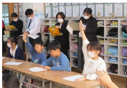
積極的な姿勢がうかがえます。