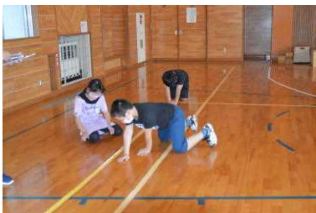
体育館の床に目印を付けました