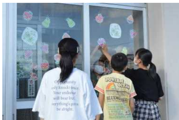
玄関の飾り付けも完成です