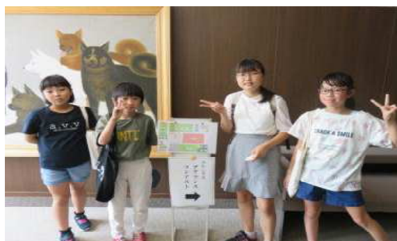
アナウンスコンテスト出場者のみなさんです