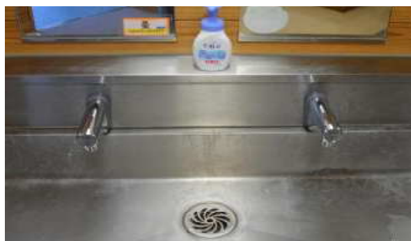
児童トイレの流しに自動の蛇口が付きまして