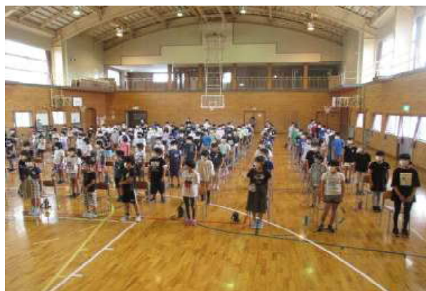
始業式、全員学校に来ました