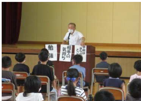
2学期頑張るって欲しいこと(校長の話)