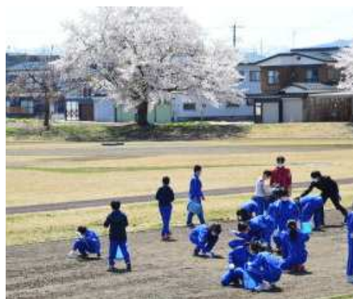
〈木の枝や、石を拾っています〉

23日(金)学校の陸上競技場を整備しました。コロナの心配もあるので、子どもたちと先生方で行いました。今年は大雪の影響で、折れた桜の枝がかなり散らばっていたのですが、子ども達の頑張りで、たくさん拾うことができました。みんな愚痴も言わず熱心に取り組むことができていたので、「三輪小の子どもたちは仕事にまじめに取り組める」というよさが改めて確認できました。よい活動でした。