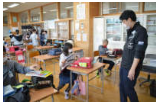
5年生は、三密を避けるため教室を2階の外国語ルームに移動しました