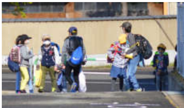
友達の顔を見て思わず走り寄っていました

過去のブログを見ますと、修学旅行の様子や子どもたちの様子などたくさん情報（令和元年度は111回）が載っていました。回数は昨年並みにできるかわかりませんが、子どもたちの様子を学校から発信したいと思います。