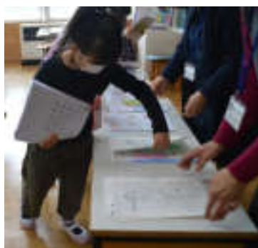
← 1年生はしっかり提出物を出していました