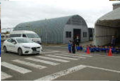
1年生は横断歩道の渡り方