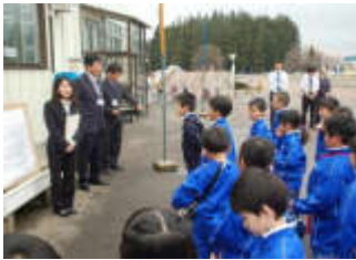
職員の皆さんの全面バックアップ