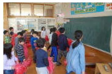
6年生の背中を見ながら練習中です

今年は、半日日程とはいえ種目は、さほど変わりません。応援合戦では、ダンス部分はなくなったものの「エール合戦」として生の声で勝負します。なかなかの勝負です。楽しみにしてください。5、6年生のリーダーぶりも様になってきました。今まで見られなかった頼もしさを発見してもらえればうれしいです。