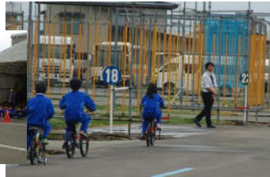
教習コースを走ります

4月29日に、下学年の交通安全教室を行いました。羽後自動車学校のご厚意により、実際のコースを使用し、さらに教官の皆さんのご指導もいただきながら実地訓練ができました。