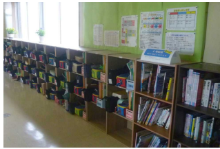
廊下の棚の整理整頓！！ 他の学年のよきお手本です。