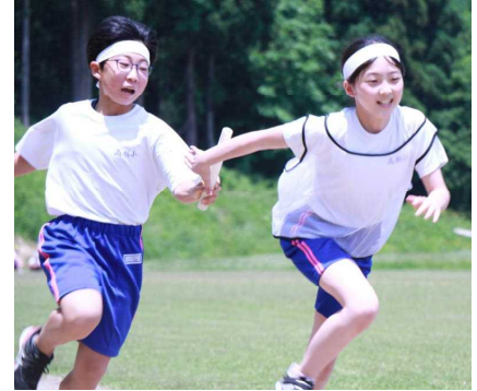
上学年全員リレー

平日にもかかわらず、保護者の皆様にはたくさん応援に来ていただき、本当にありがとうございました。