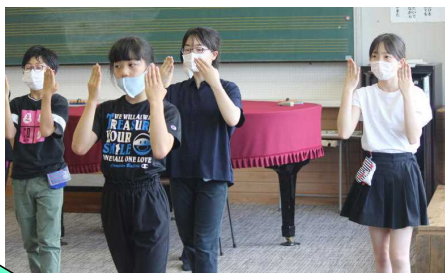
「西馬音内盆踊り」の練習風景