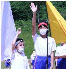
開会式・誓いの言葉