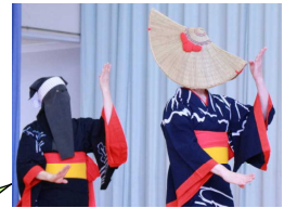
6月13日 夢キラ鑑賞会のようす