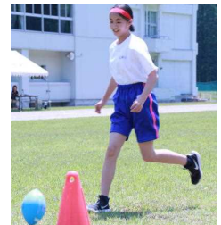
オリンピックリレー